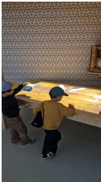
De très jeunes visiteurs aux journées du patrimoine